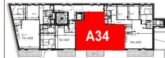
Bâtiment A - R+3