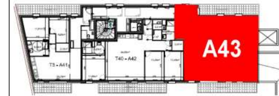
Bâtiment A - R+4